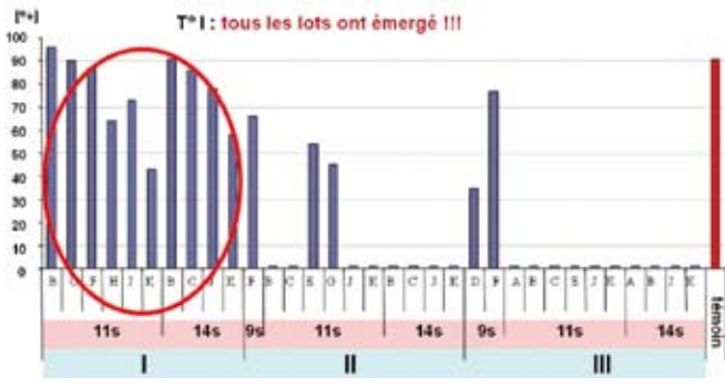
Figure 1 - Pourcentage d'émergence chez T. chilonis après différentes durées de stockage (9, 11, ou 14 semaines). Les lettres indiquant les différents stades de développement et les chiffres romains indiquant les trois températures étudiées.