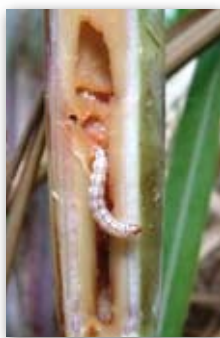
Photos 2A et 2B - Le parasitoïde Trichogramma chilonis .