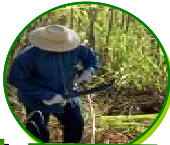
Des agriculteurs et des amateurs de jardin