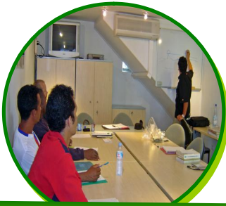
Des responsables de filières agricoles, de service et de Jardins Espaces Verts