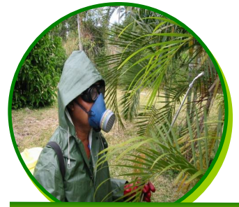
Du personnel exécutant